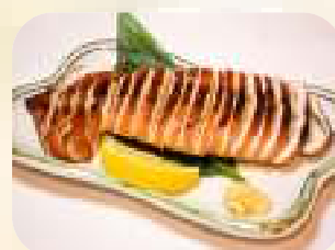
いか丸焼き 556円 (税600円)