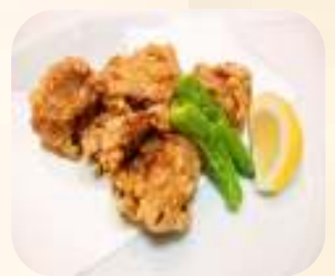
鶏の唐揚げ 538円 (税580円)