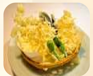
なます天ぷら 630円 (税680円)