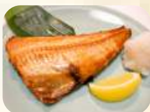
ホッケ塩焼き 695円 (税750円)