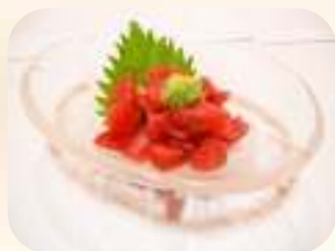
まぐろぶつ 463円 (税500円)