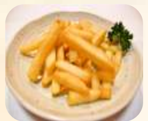
フライドポテト 260円 (税280円)