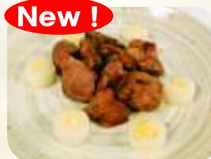
コリコリ塩砂肝 352円 (税380円)