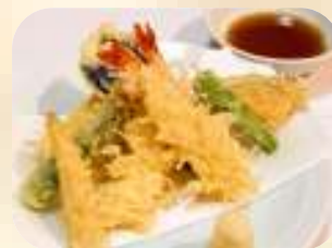
天ぷら盛合わせ(小) 1,019円 (税1,100円)