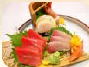
刺身盛合わせ(小) 1,204円 (税1,300円)