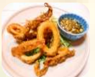
イカの唐揚げユリソース 510円 (税550円)