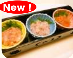
イカさんまい (塩辛、麴漬、明太子和え) 463円 (税500円)