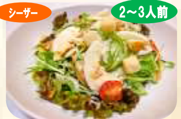
シーザー 2~3人前 シーザーサラダ 538円 (税 580円)