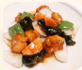
酢豚 815円 (税 880円)