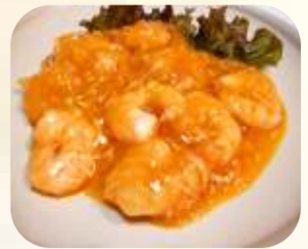
海老のチリソース 834円 (税 900円)