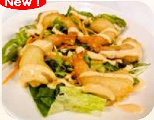
プリプリ海老サラダ 630円 (税 680円)