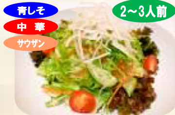
青しそ 中華 サウザン 2~3人前 野菜サラダ 463円 (税 500円)