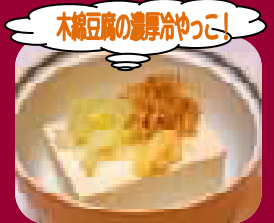
木綿豆腐の濃厚冷やっこ! やっこ