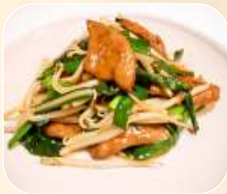
レバニラ炒め 741円 (税 800円)