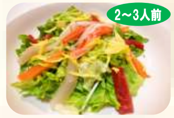
2~3人前 海鮮サラダ 788円 (税 850円)