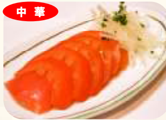
中華 冷しトマト 278円 (税 300円)