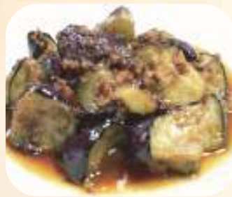
茄子のピリ辛炒め 676円 (税 730円)